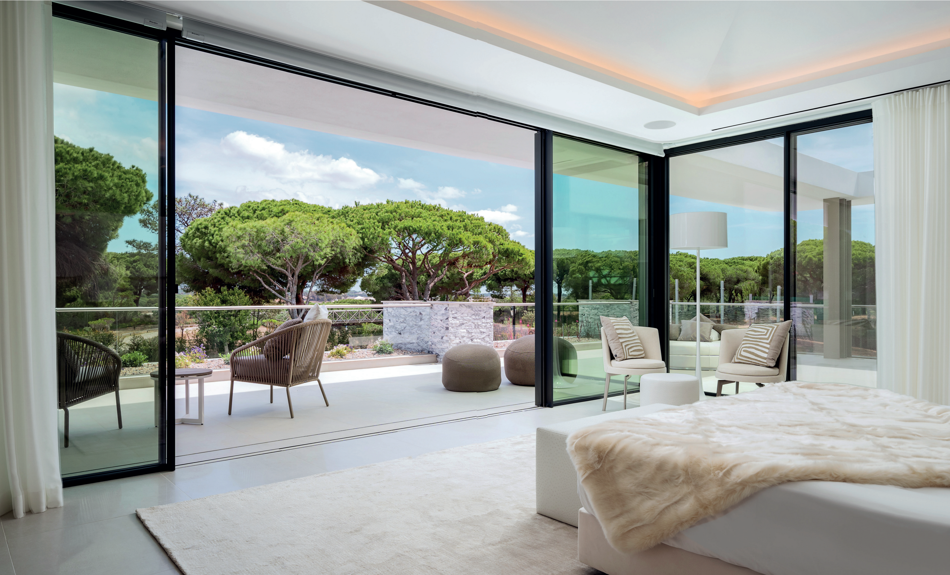
Carefully designed master suite with elegant textures encompassed by a sublime view of the pool, garden and golf.