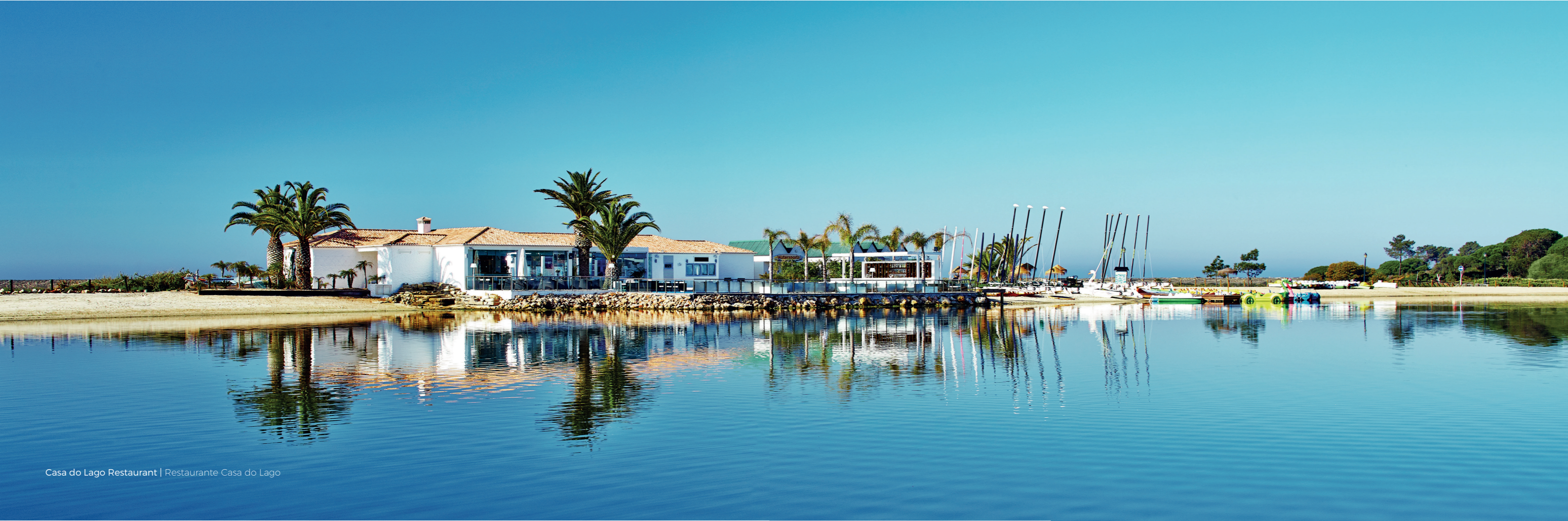
Casa do Lago Restaurant | Restaurante Casa do Lago