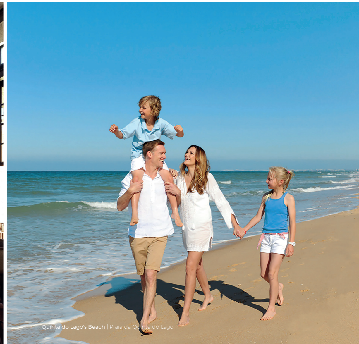
Quinta do Lago's Beach | Praia da Quinta do Lago