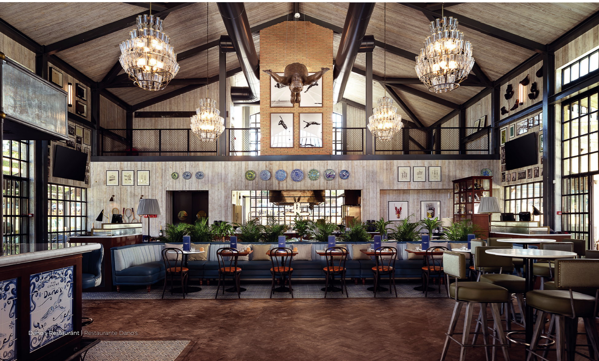
Dano's Restaurant | Restaurante Dano's