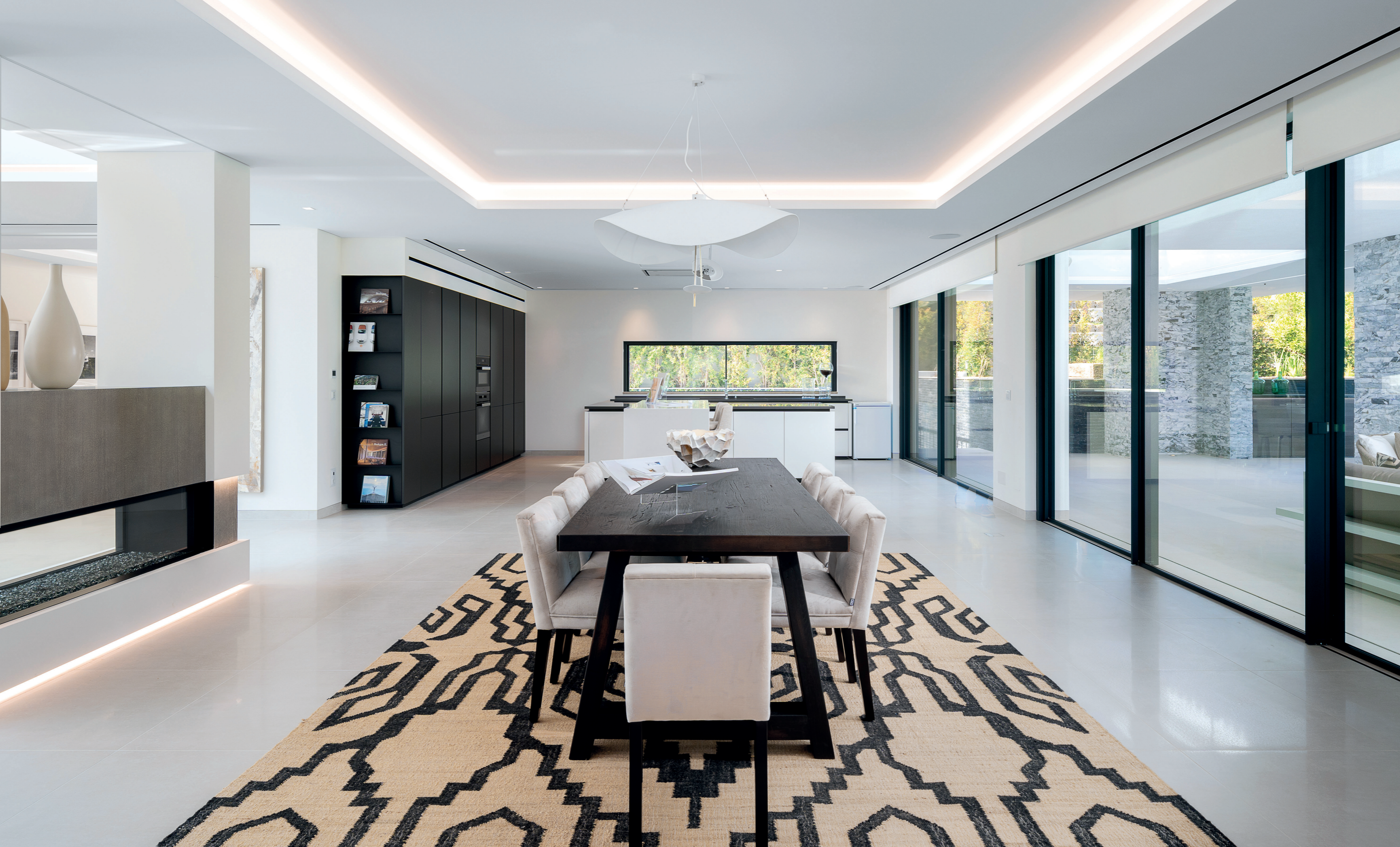
Open plan living room filled with natural light, creating a comfortable and inviting space.