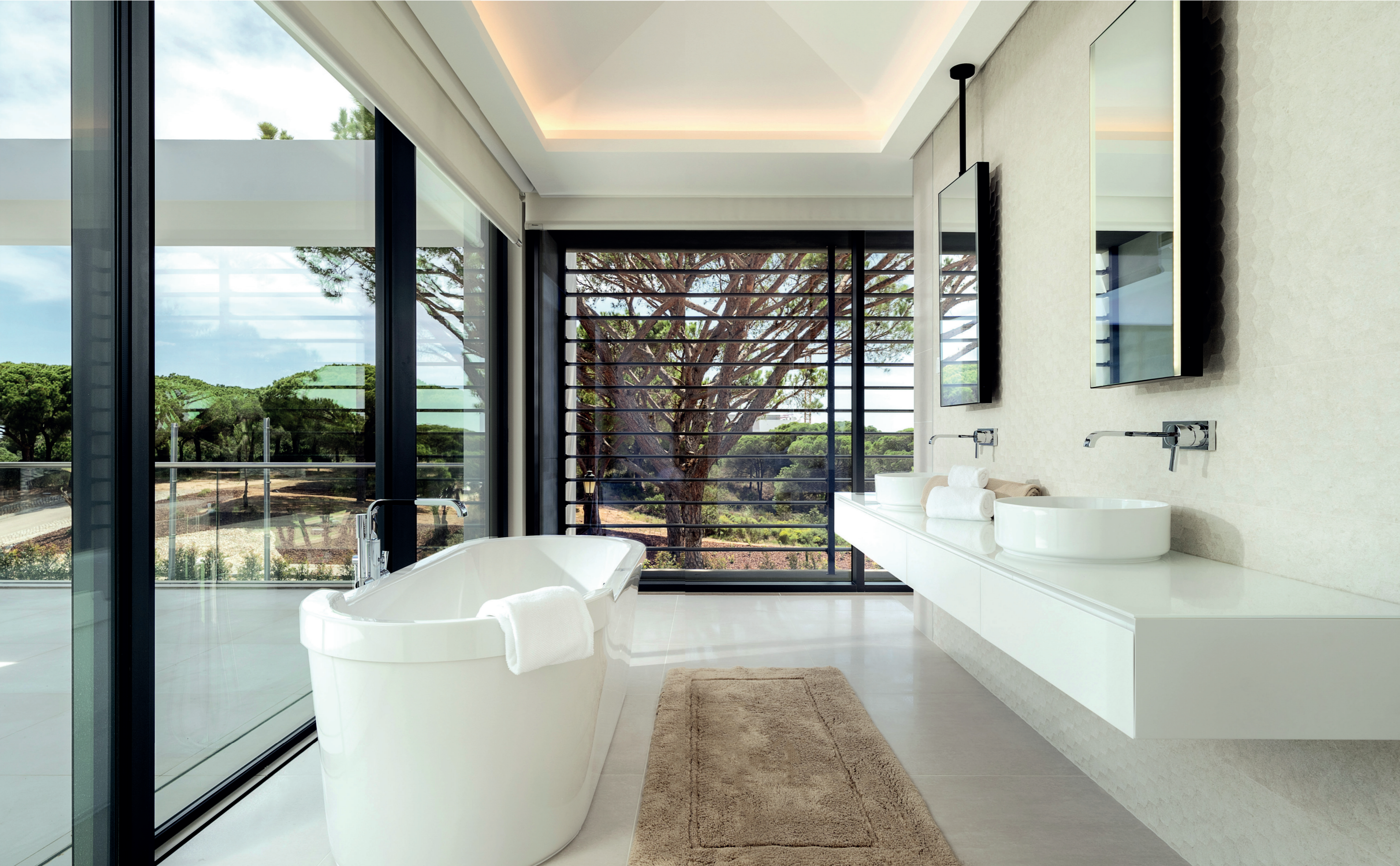
Sophisticated and unique - the master suite bathroom.